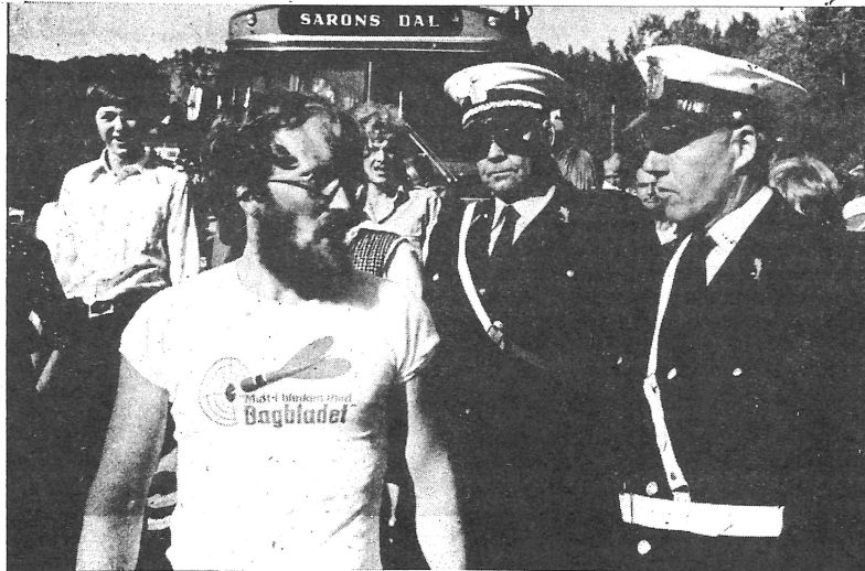
Hedningelederen Arild Karlsen ble arrestert