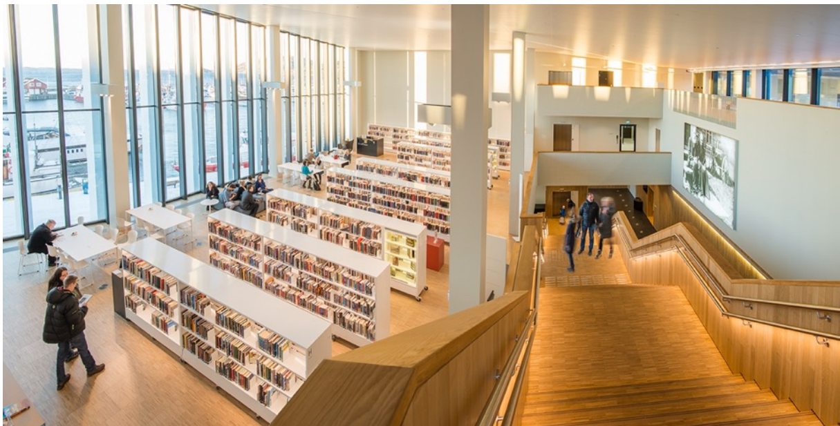
Interiør fra Stormen bibliotek, Bodø.