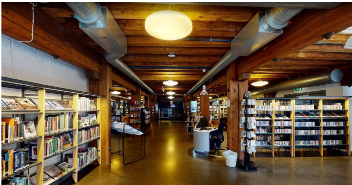
Moss bibliotek, bokhyller.

Vår kontakt med informantene viser at det er enklere å prioritere publikumsarealer i nybygg, og at i en situasjon for planlegging av nybygg må man prioritere dette tydelig. Å bygge med fleksibilitet i rommene kan bidra til å gjøre dette mulig.