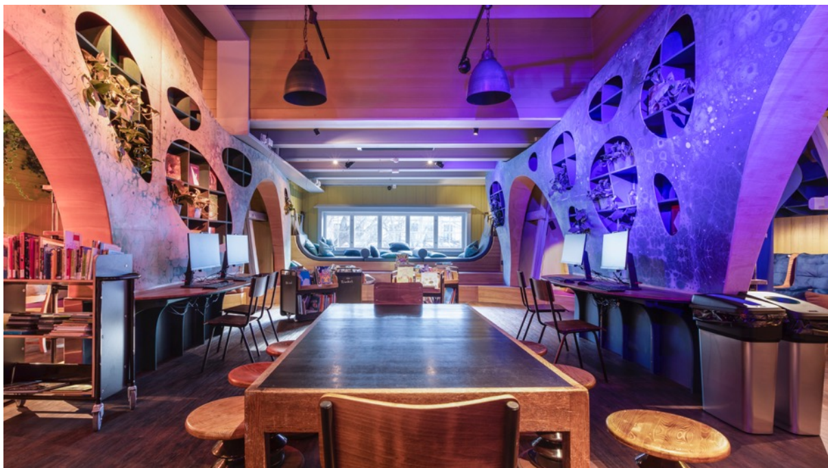
Deichman Grünerløkka. Interiør etter modernisering.