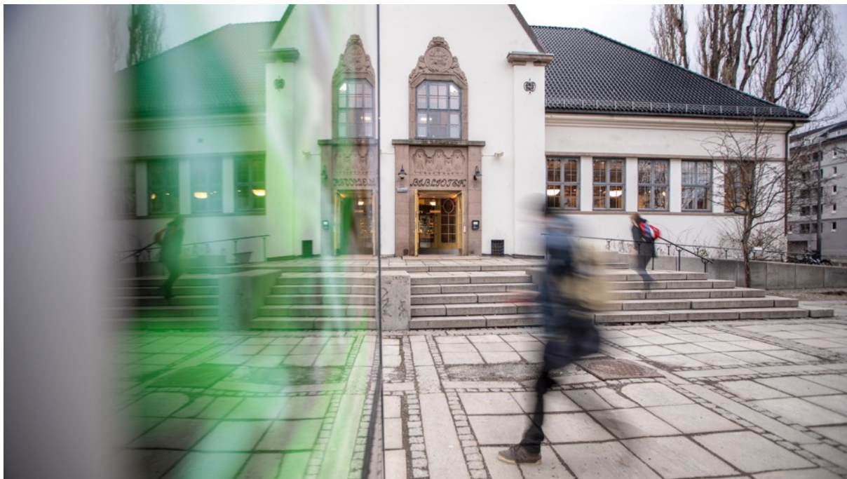
Deichman Grünerløkka. Eksteriør.