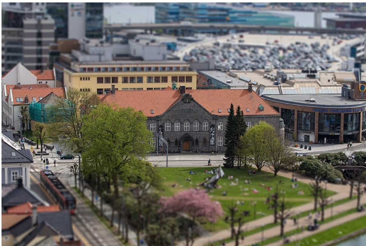
Bergen Offentlige Bibliotek

Det kan se ut som om jo større by/bibliotek, jo lenger tid tok det før ideen er født til det ferdige resultatet sto der. Det er også en sammenheng mellom de ansattes tilfredshet sett opp mot graden av involvering og medvirkning i prosessen. Vi fikk også innblikk i “profesjonsstrider” mellom interiørarkitekter/arkitekter/planleggere og biblioteksjef. Enkelte opplevde det som vanskelig å skulle løfte fram selve ideen bak et moderne folkebibliotek, og måtte stå hardt på sitt for å unngå at det nye bygget skulle være for brukerne, ikke bøkene.