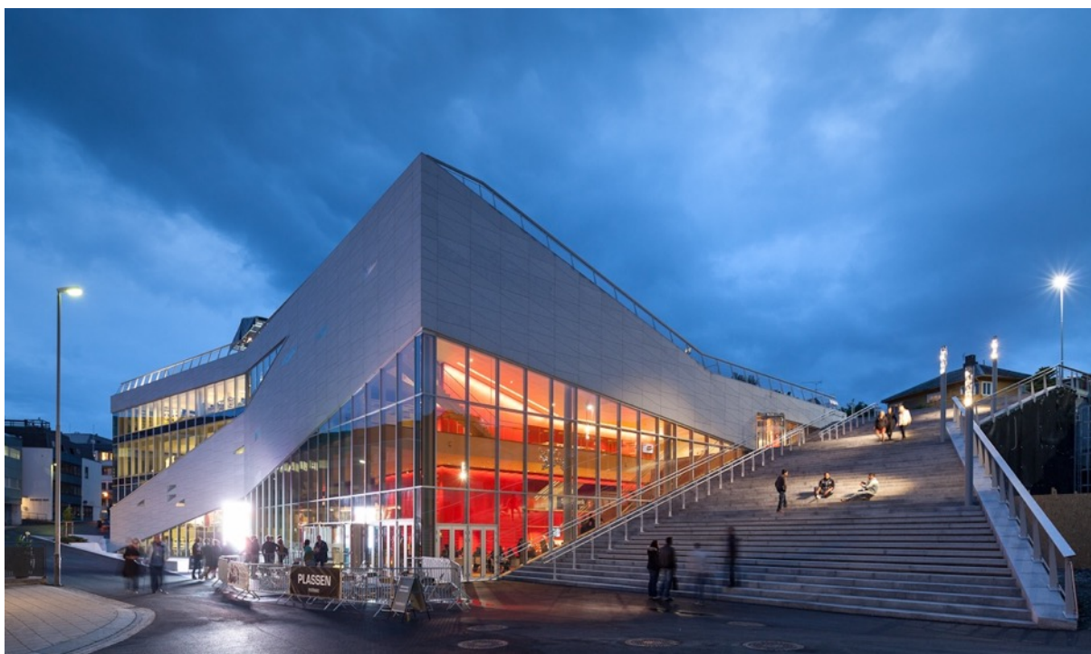
Molde bibliotek.