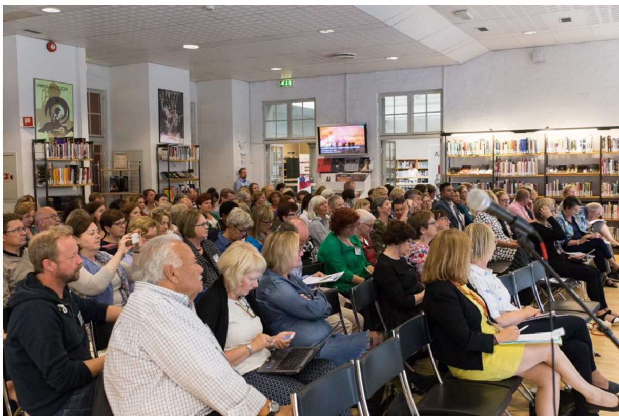
Arrangement på Bergen Offentlige Bibliotek.

En generell erfaring er at initiativet til nybygg oftere kommer fra eksternt hold, altså fra politikere eller administrasjon. Ofte også i samarbeid med biblioteket. Ved større ombyggingsprosjekter kommer initiativet som regel fra biblioteket selv. Jo mer involvert biblioteket har vært i prosessen, jo bedre blir resultatet. Bibliotekprosjekter hvor biblioteket har blitt brukt som en "brikke" i et byutviklingsprosjekt, og samtidig har vært lite involvert, er i mindre grad vellykkede.