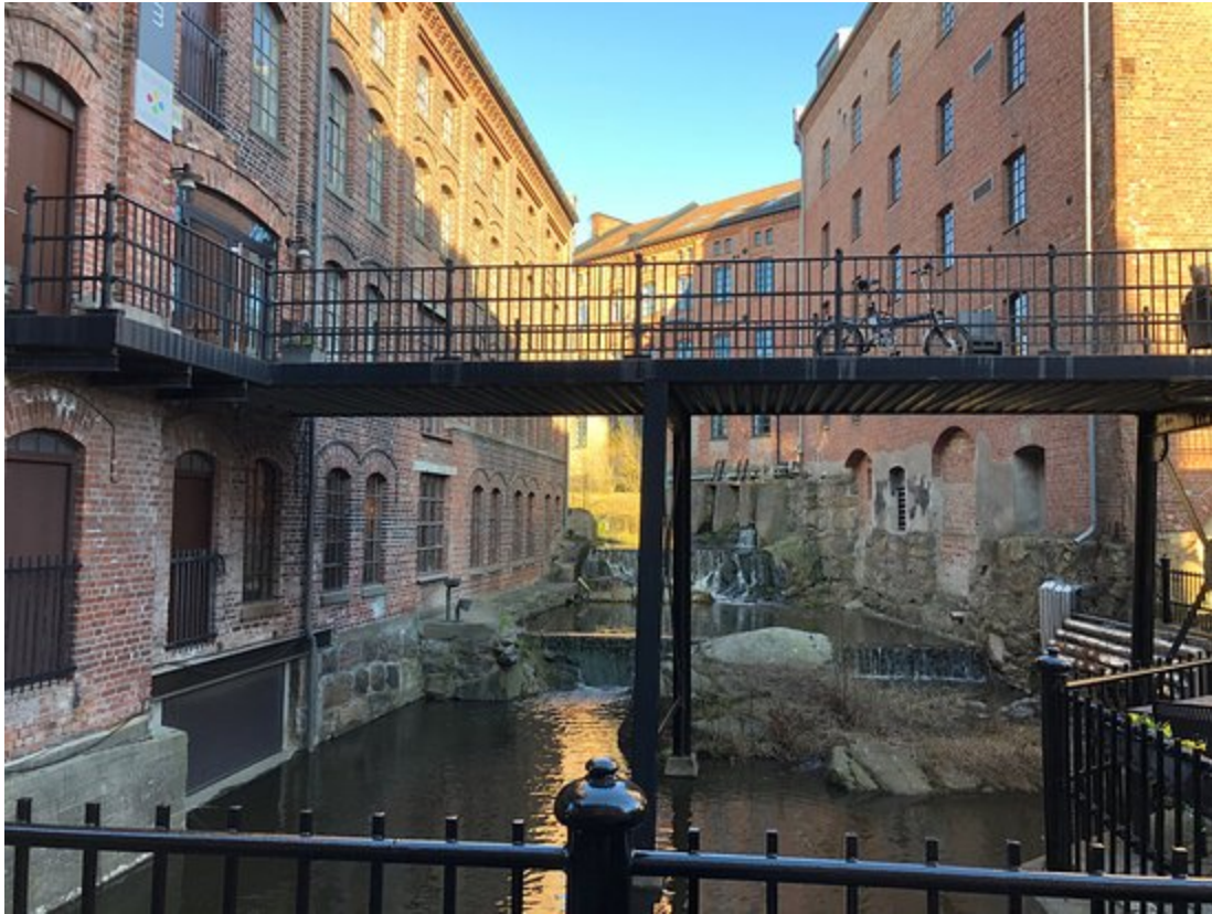
Moss bibliotek i Mølleparken