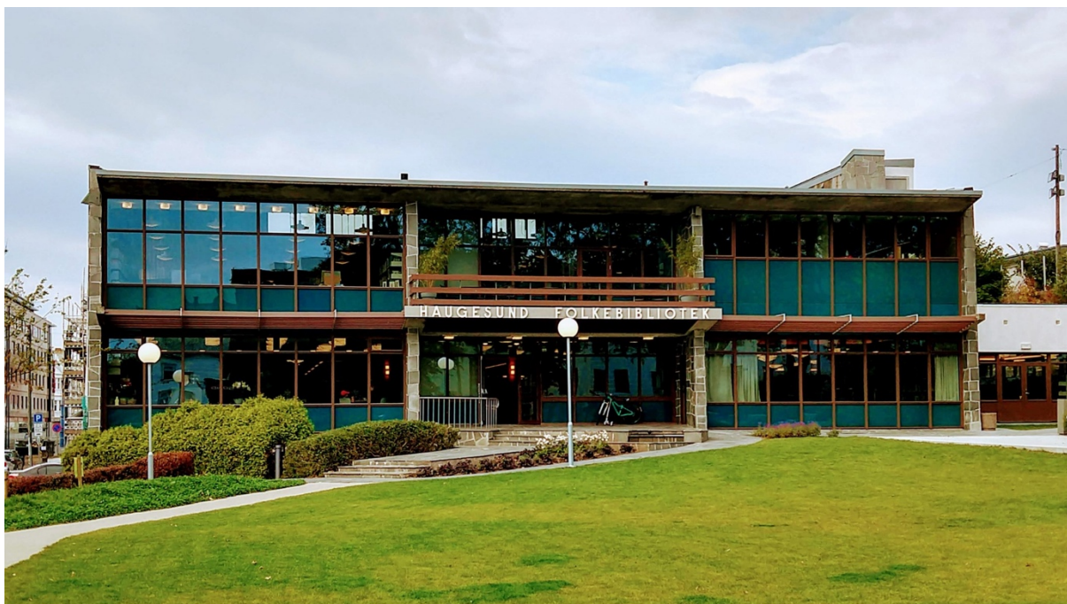
Haugesund folkebibliotek.