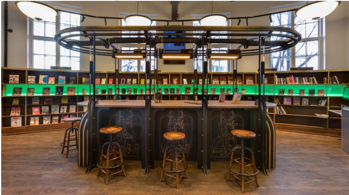
Deichman Grünerløkka, leseavdeling etter modernisering.

I forbindelse med nybygg og ombygging av bibliotekbygg er det nødvendig å ta noen forbehold knyttet til intervjuer og informanter. Vi har valgt å kun benytte biblioteksjefer som informanter. I en situasjon med større tidsramme og mer ressurser tilgjengelig ville det vært naturlig å få perspektivene fra flere typer informanter. Brukere av biblioteket, ansatte, administrativ og politisk ledelse i kommunen er eksempler på dette.