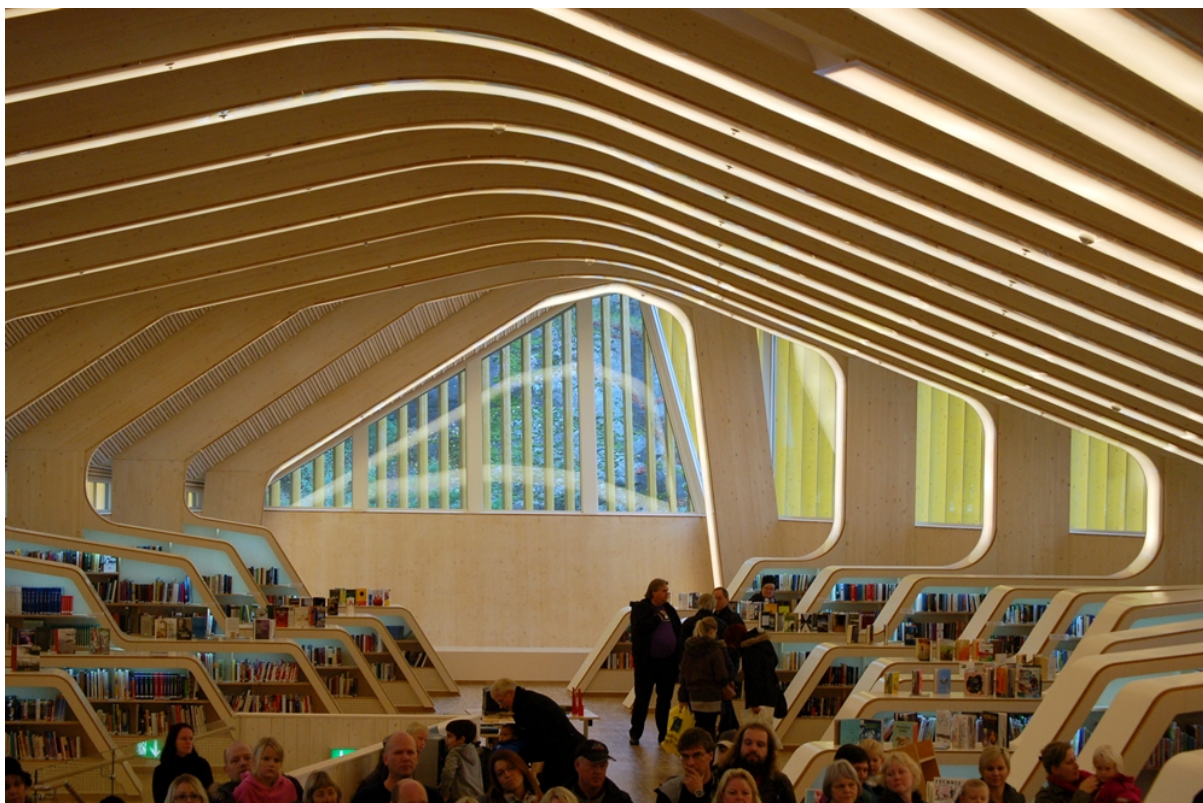
Vennesla bibliotek, interiør med besøkende på omvisning.