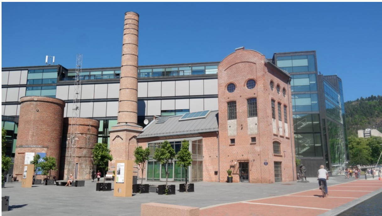
Drammensbiblioteket, en viktig brikke i transformasjonen av industribydelen Grønland.