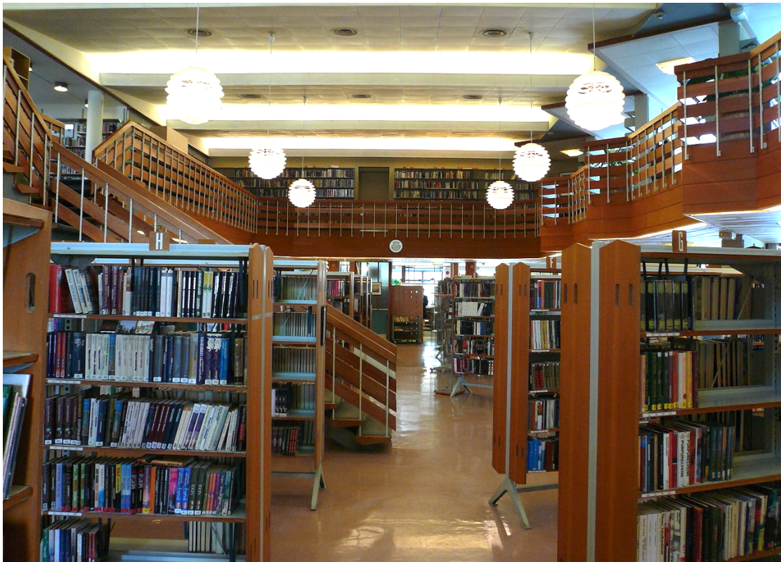
Haugesund folkebibliotek, interiør.