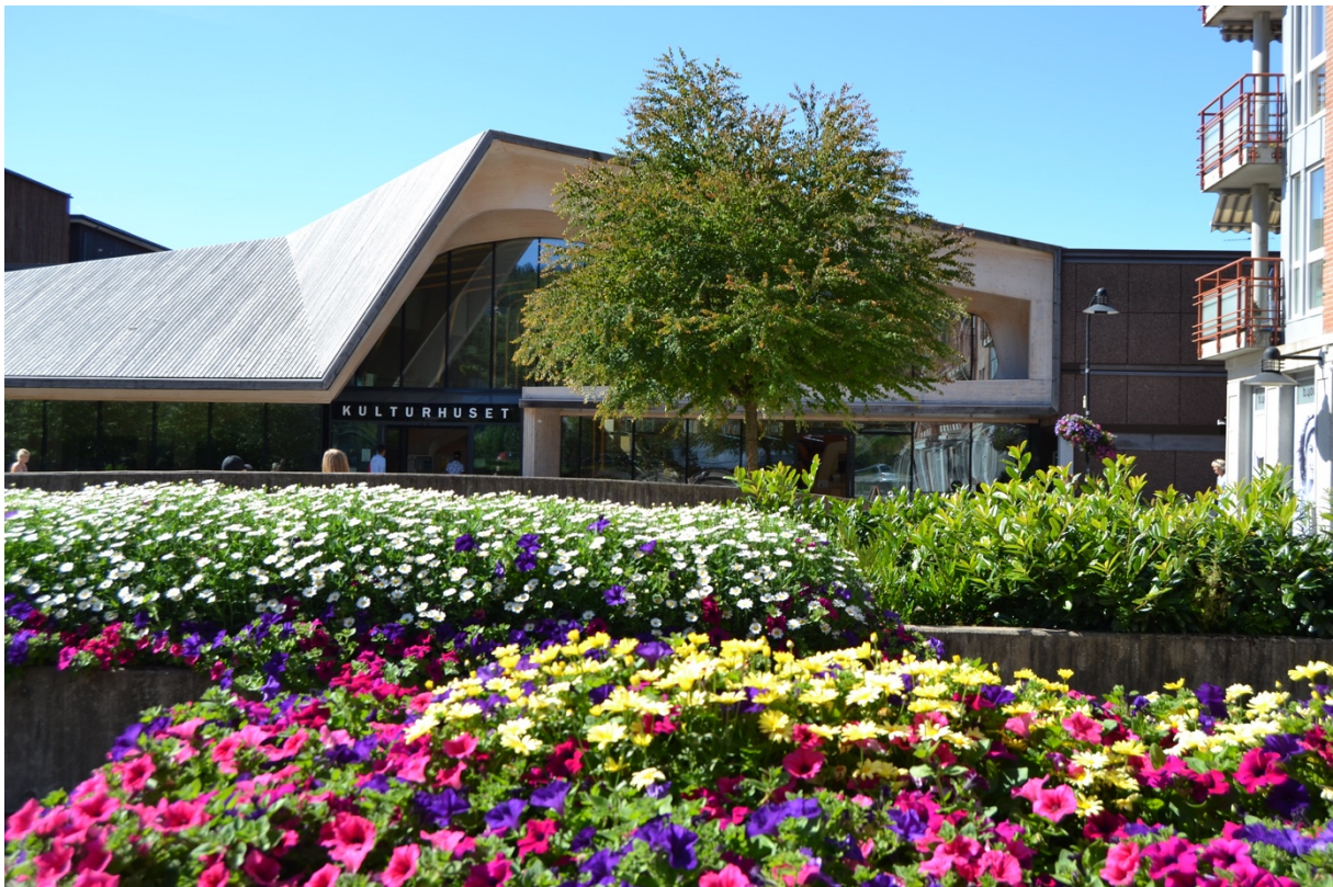
Vennesla kulturhus og bibliotek, eksteriør.

Ingen av de vi snakket med opplevde at de hadde mistet brukere, kanskje en håndfull var borte. Den største utfordringa for alle bibliotek i dag er ungdommene, de er vanskelig å nå uansett. Men alle kan fortelle om nye brukergrupper og nye folk. Når en vet at biblioteket er å regne for det tredje stedet, ikke ute, men heller ikke hjemme, så forteller flere om at det er tydelig at biblioteket bøter på ensomhet blant folk. En eldre mann som satt i en stol på lukkede øyne, fortalte at “jeg sitter her og nyter lyden av folk”. Flere bibliotek som har bygget nytt forteller også de opplever en slags statusheving. Brukere av typen høy utdanning og høy lønn, gjerne menn i 30-50 årene, benytter biblioteket til konsentrasjon, jobbing og lignende. Enkelte forteller at noen brukere fortsatt sørger over biblioteket som det tapte “stille stedet”, men de er i mindretall. Større bibliotek kan vise til stillere soner, men dette er ikke like enkelt for de mindre bibliotekene. De fleste viser også til stor stolthet og tydelig medeierskap fra brukerne, og at de gjerne tar med seg tilreisende for å vise fram biblioteket sitt.