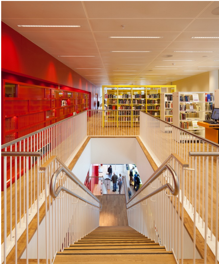
Molde bibliotek.