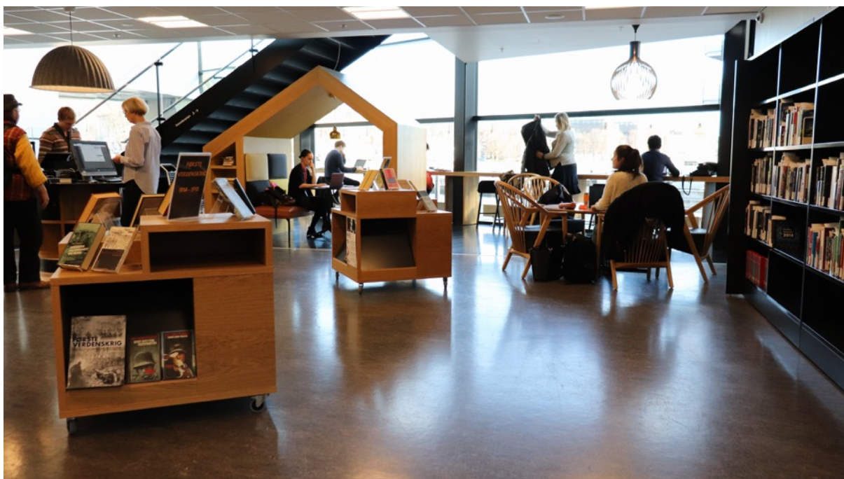
Informasjonssranken på Drammensbiblioteket.

Det har vært nødvendig å finne representative årstall å sammenligne, slik at tallene ikke blir påvirket av stenging i forbindelse med flytting/ombygging, begrensninger knyttet til Korona eller andre forhold.