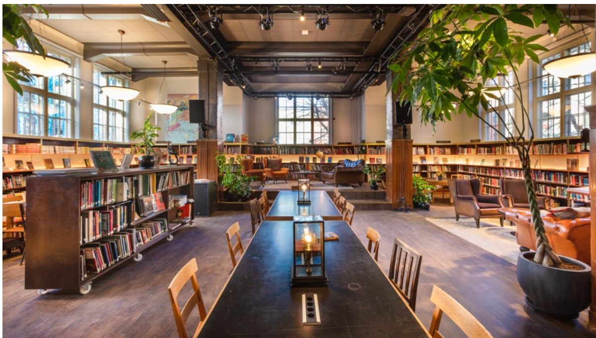
Deichman Grünerløkka etter ombygging 2019 Foto: Marco Heyda/Aat Vos

Det er altså ikke slik at en biblioteksatsing som innebærer nybygging er garantert suksess. Likevel gir nybygging mulighet for å tenke moderne bibliotekfunksjoner fra dag 1 i planleggingsfasen. Ideelt sett kan prioritering av publikumsarealer, fleksibilitet i romløsning og møblering, scene, og flerbruk komme tidlig inn i prosessen. Det er også vesentlig å se på hva som er tendenser innenfor moderne bibliotekutvikling, hva slags tjenester som vokser, hva slags funksjoner som etterspørres og hva man kan forvente av behov i fremtiden. At biblioteket (Biblioteksjefen) får en sentral plass i prosessen med eiendomsutvikler-teamet med prosjektleder og arkitekter, er avgjørende for at det nybygde biblioteket skal bli en suksess. Flere relativt nye bibliotekbygg må bygges om etter få år, og dette skjer ofte når biblioteket selv ikke har fått delta aktivt i utformingen fra tidlig fase.