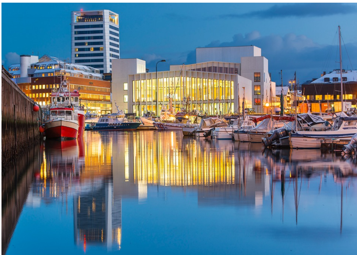
Stormen bibliotek, Bodø.

Casene er et utvalg av bibliotekprosjekter som er relevante for Fredrikstad. Det vil si eksempler på bibliotek som har valgt å bygge nytt, og bibliotek som har valgt å tilpasse eller bygge om eksisterende lokaler i forbindelse med en større satsing på bibliotekutvikling og fornying. Av de som har videreutviklet eksisterende lokaler har teamet i stor grad valgt bibliotekbygg med tydelige kulturminneverdier, og som har vært underlagt begrensninger knyttet til vern. Dette har enten vært i form av vedtaksfredning fra Riksantikvaren, eller kommunale vernebestemmelser med relativt omfattende restriksjoner knyttet til endring og modernisering. I utvelgelsen av caser har teamet også valgt byer som har relativt lik størrelse som Fredrikstad. I tillegg til dette har et par av casene en sammenlignbar beliggenhet med dagens bibliotek i Fredrikstad, noen hundre meter utenfor den absolutte bykjernen.