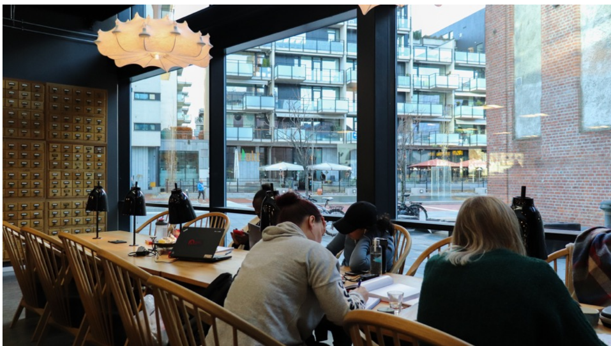
Studenter i Drammensbiblioteket

Tidligere var mat og drikke gjerne vært forbudt i biblioteket, for å unngå søl, sjenerende lukt osv. Nå har mange bibliotek kafé eller kaffebar integrert i lokalet, eller i umiddelbar tilknytning til biblioteket. Utlånstall og antall bøker i bokstammen var viktige faktorer for suksess tidligere. Nå har besøkstall og blitt en vel så viktig måleparameter i statistikken fordi en først og fremst er ute etter å måle aktiviteten i biblioteket. Brukere kan oppholde seg i biblioteket i mange timer uten å registrere et eneste utlån.