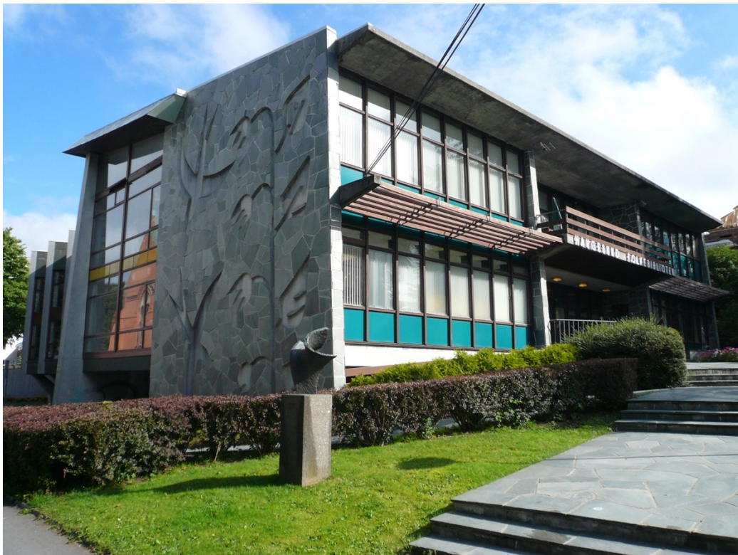
Haugesund folkebibliotek, eksteriør.

Der det blir tenkt nytt rundt bibliotekdrift og samskaping, har vi også sett de mest vellykkede resultatene målt i utlånstall, men aller mest besøkstall. Flere av respondentene har vært klare på at uten dette samarbeidet ville ikke biblioteket fått til det samme med de ressursene de har. Det oppleves dessuten som attraktivt for andre institusjoner og organisasjoner å samarbeide med bibliotek, fordi det er en lovpålagt og forutsigbar kommunal tjeneste som har stor tillit blant innbyggerne.