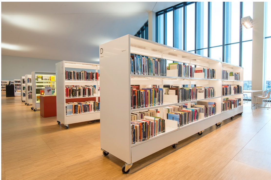
Flyttbare bokhyller, Stormen bibliotek, Bodø.